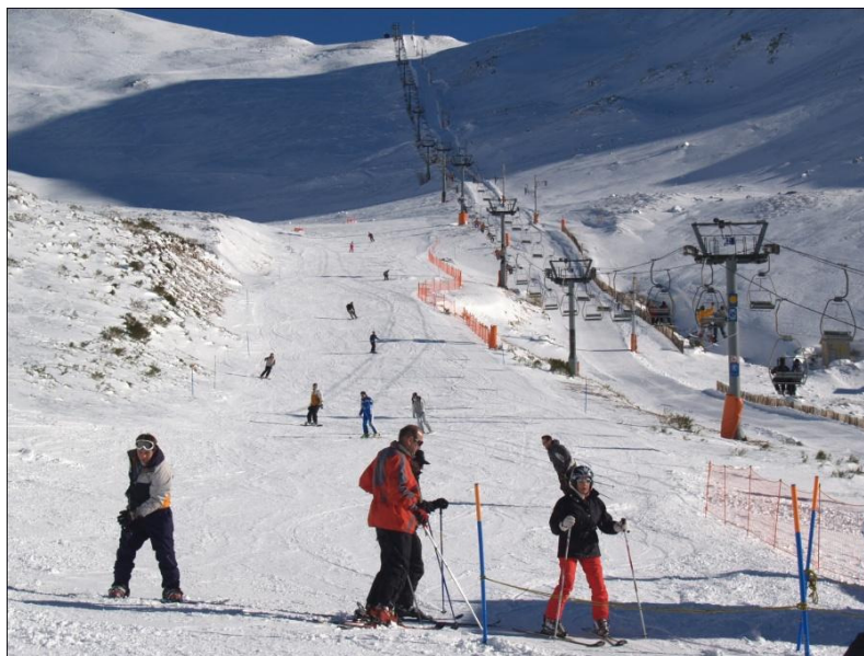
Vista de la estación en Riopinos (Valdelugeros)